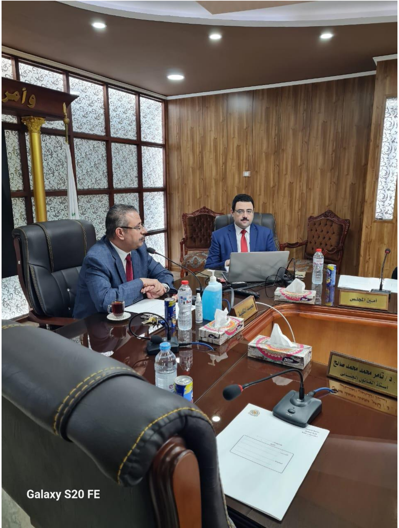
Galaxy S20 FE