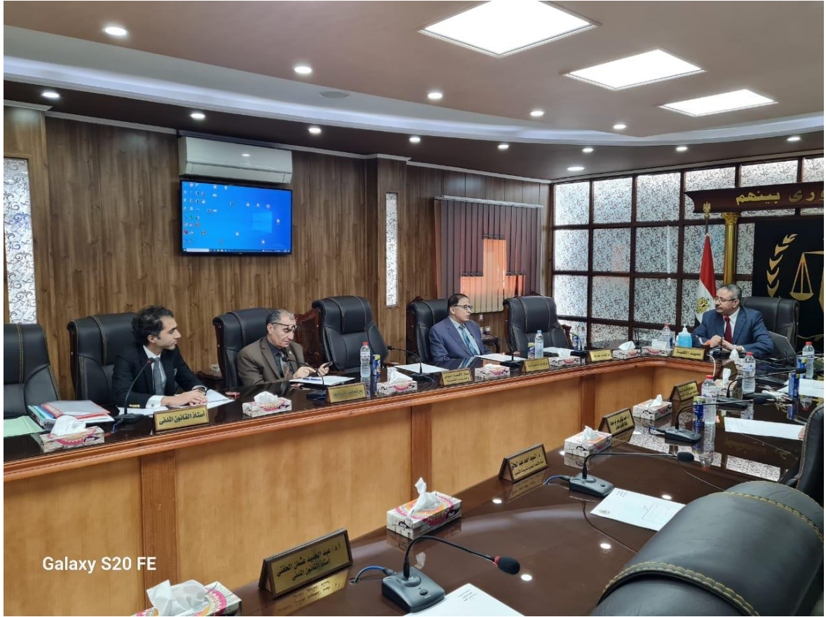
Galaxy S20 FE