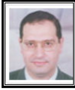
أ.د / أشرف سويلم نائب رئيس الجامعة للداسات العليا والبحوث