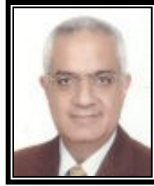
أ.د / أشرف عبد الباسط نائب رئيس الجامعة لشئون التعليم والطلاب