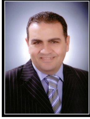
أ.د / محمد القناوي رئيس جامعة المنصورة