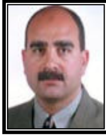
أ.د / محمود محمد إبراهيم المليجي نائب رئيس الجامعة لشئون خدمة المجتمع وتنمية البيئة