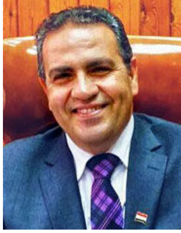
أ.د/ محمد القناوي رئيس جامعة المنصورة