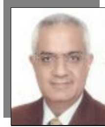
أ.د/ أشرف عبد الباسط نائب رئيس الجامعة لشؤون التعليم والطلاب