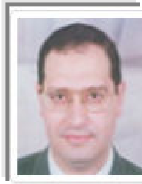
أ.د/ أشرف سويلم نائب رئيس الجامعة للدراستات العليا والبحوث