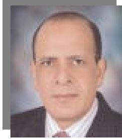
أ.د/ زكى زيدان نائب رئيس الجامعة لشؤون خدمة المجتمع وتنمية البيئة